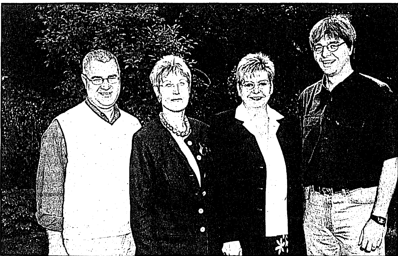
260 Kurse hat das Team der Erwachsenenbildung Stein-Egerta für das Herbstprogramm zusammengestellt.

Von «A» wie Adventsdekorationen bis «Z» wie Zeichen bietet sich im Freizeitbereich eine bunte Vielfalt an Kursen. Organisiert werden all diese Angebote von den Gemeindebeauftragten. Sie nehmen eine wichtige