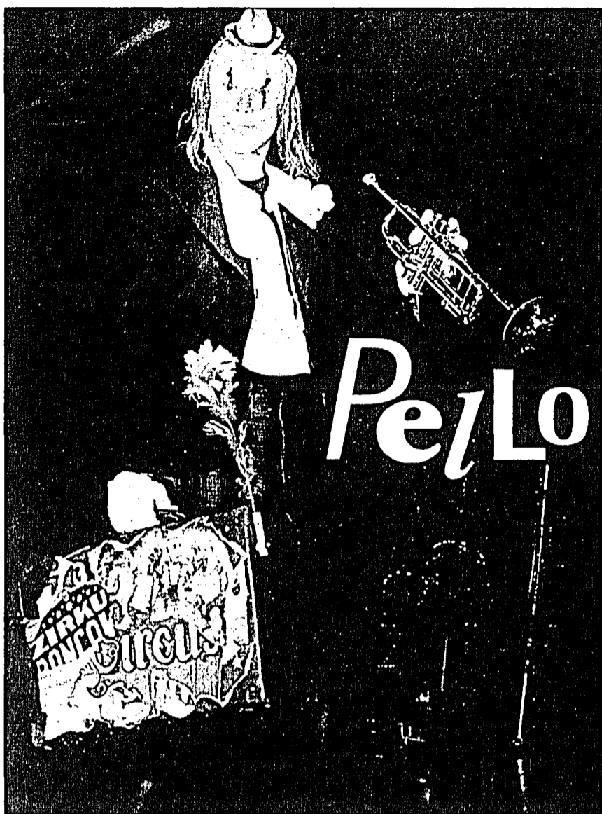
Der berühmte Clown «Pello» ist am 24. August auf Burg Gutenberg in Balzers zu bewundern.

Detaillinformationen zum Humorfestival und Reservationen für die Best-of-Pello-Show am Samstagabend: Haus Gutenberg, 9496 Balzers, Telefon 00423 / 388 11 33. Weitere Infos unter www.haus-gutenberg.li sowie www.humorakeli.li .