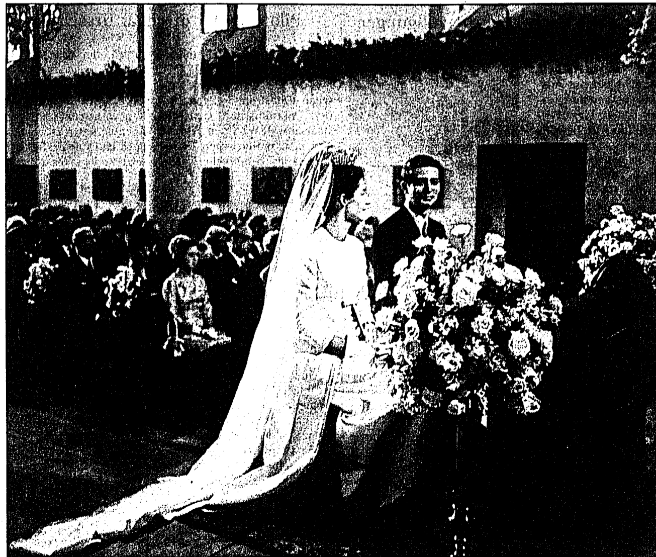
Heute vor genau 35 Jahren, am 30. Juli 1967, erlebte Liechtenstein eine wahre Traumhochzeit: Bei herrlichem Sonnenschein gaben sich Erbprinz Hans-Adam von Liechtenstein und Gräfin Marie Kinsky das Ja-Wort (Archivbild). Dem heutigen Landesfürstenpaar gratulieren wir zum 35. Hochzeitstag herzlich.

Unvergessliche Hochzeit am 30. Juli 1967 in Vaduz