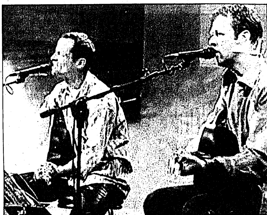
Heute Abend beim Schaaner Sommer: «Orpheus 2».

Die Gemeinde Schaan, der Unihockeyclub und «Orpheus 2» würden sich freuen, zahlreiche Gäste auf dem Rathausplatz verwöhnen zu dürfen. Unser Motto für diesen Abend lautet: «Let's groove!» Auch heute Abend ist der Eintritt frei.