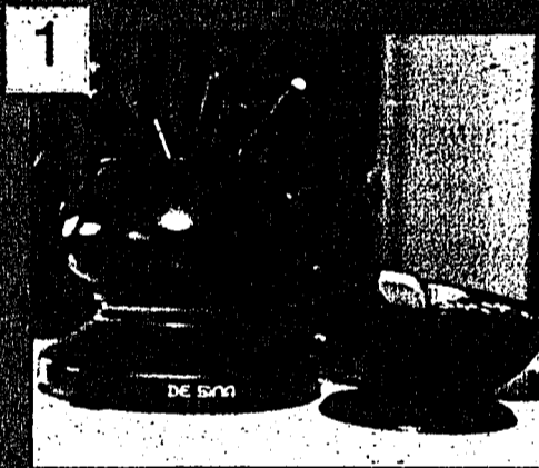
1 DE SINA Fondue/Wok Aufpreis: gratis

Elektrisches Stövchen zur Beheizung eines Fondue- oder eines Woktopfes. Fonduepotf - antihafbeschichtet - mit 8 Fonduegabeln (4 farbige Endknöpfchen). Woktopf - antihafbeschichtet - mit Ablagerost und Holzspatel für die Zubereitung von asiatischen Köstlichkeiten. Betriebskontroll-Leuchte am Stövchen. 800 W. Farbe: Schwarz.