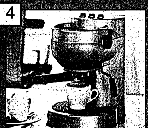
4 DE SINA Espressomaschine Aufpreis CHF 99.-

Reise-Trolley: Aus Rip-Stop Polyester gearbeitet, 1 ABS-Handgriff, 1 Reissverschlussvordertasche, mit umlaufendem Reissverschluss zu öffnendes Hauptfach. Innen: Packgurte, abnehmbare Strupptasche und im Deckel befindliche Reissverschluss tasche. Entspricht den neuen IATA-Abmessungen. Masse: ca. B35 x T22,5 x H50 cm. Und Reise-Umhängetasche: Aus Rip-Stop-Polyester gearbeitet. Innen: kleines Dokumentenfach mit Visitenkarten-Steckfächern, Adressfach und Schreibgeräteschlaufen. Seitlich je 1 Reissverschluss tasche, eine zusätzlich innen mit Handysteckfach. Rückseite gedoppelt zum Aufstecken auf Trolleygestell geeignet. Masse: ca. B40 x T15,5 x H32 cm. Nr. 089 756-6