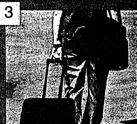
3 Reise-Set Aufpreis: CHF 49.-

Zigarren werden brüchig und verlieren ihr Aroma, wenn sie nicht mit der richtigen Feuchtigkeit gelagert werden. Zum Aufbewahren von Zigarren eignen sich daher am besten Humidore, die für die richtige Luftfeuchtigkeit sorgen. Diese Humidore enthalten je einen Hygrometer und Luftbefeuchter zum Regulieren der Luftfeuchtigkeit innerhalb des Humidors. Sie bestehen aus aussen beschichtetem Zedernholz. Die Fachaufteilung ist verstellbar, der Deckel mit versenkbaren Metallscharnieren versehen. Lieferung erfolgt ohne Zigarren. Masse: ca. B22 x T26 x H11 cm. Nr. 118 043-6