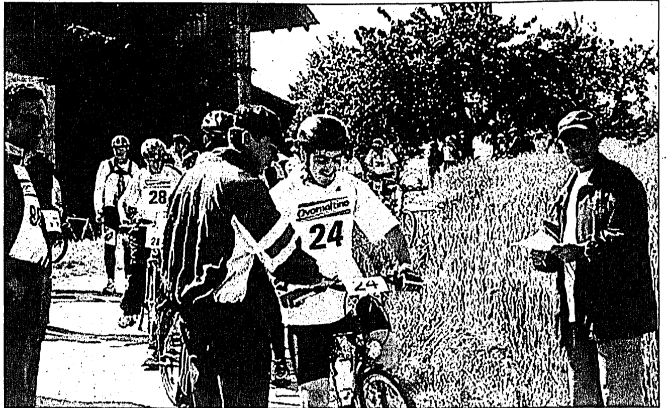
Ab morgen wird in Lausanne im Rahmen der nationalen Sommerspiele von Special Olympics um Medallenehren gekämpft.

Wir werden beim Rad fahren, Schwimmen und Boccia im Einsatz sein. Beim Boccia-Wettbewerb haben wir drei Teams, beim Radrennen werden vier Liechtensteinerinnen und Liechtensteiner am Start stehen und beim Schwimmen werden es neun sein. Wir reisen mit insgesamt 20 Athletinnen und Athleten nach Lausanne. Unsere