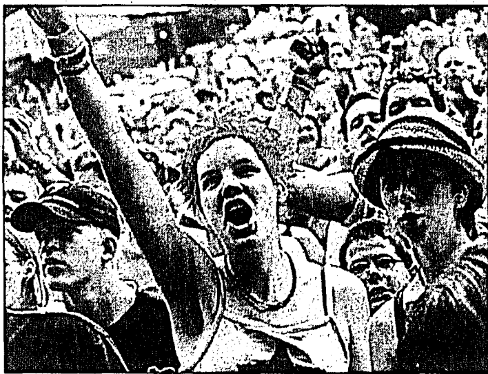
Es gibt für jeden Fan und jeden Musikgeschmack etwas.

Wasserscheue verkriechen sich dann eben im Zelt. Aber Achtung, die Tickets (pro Iglu-Zelt für zwei Personen) für die komfortable «Sleeping Zone», die man zusätzlich erwerben kann, sind beschränkt! Am besten informiert ihr euch sowieso vorher darüber auf der Homepage, wo ihr auch das genaue Programm sowie andere wichtige Hinweise, Bilder und Infos zur Veranstaltung bekommt: http://www.gurtenfestival.ch