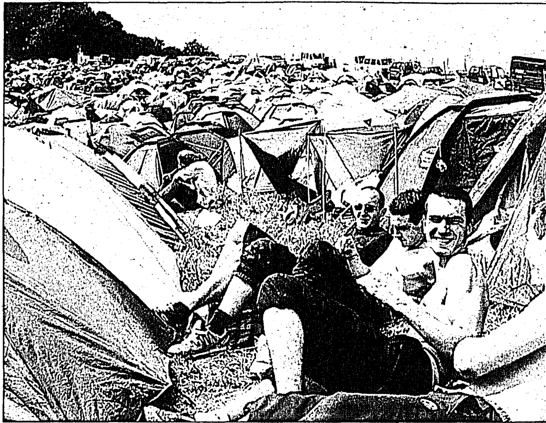
Achtung, die Tickets für die komfortable «Sleeping Zone» auf dem Gurten sind beschränkt.

Für Fans südländischer Klänge gibt es zum Beispiel Los De Abajo, Italos erfreuen sich an