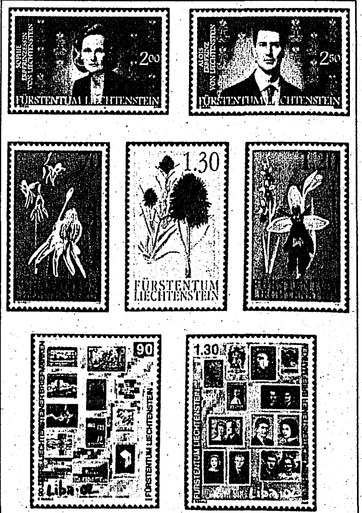
Diese drei Ausgaben erscheinen am 8. August, also genau zur Eröffnung der grossen Briefmarkenausstellung Liba '02.

Titel «Erbprinz und Erbprinzessin» gestaltet von Marianne Siegl aus Stockerau und eine Ausgabe zum Thema «Zauberhafte Orchideen» gestaltet von Regina Marxer aus Vaduz.