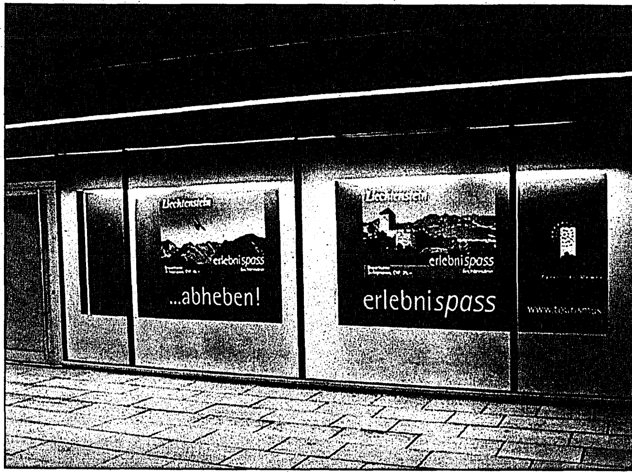
Die neu aufgestellten Schaufensterplakate im Haus Risch, Vaduz, versprechen nicht zu viel: «Anschlappen, eintauchen und abheben» mit dem «Erlebnispass Liechtenstein».

In diesen Tagen wird der Info-Flyer zum Erlebnispass an alle Haushalte des Landes verschickt. Der Flyer informiert über alle 17 Angebote, die sich im Erlebnispass zusammengeschlossen haben. Der Erlebnispass ist in vier Varianten erhältlich: Für Erwachsene und Familien steht jeweils ein Drei- oder Sieben-Tagespass zur