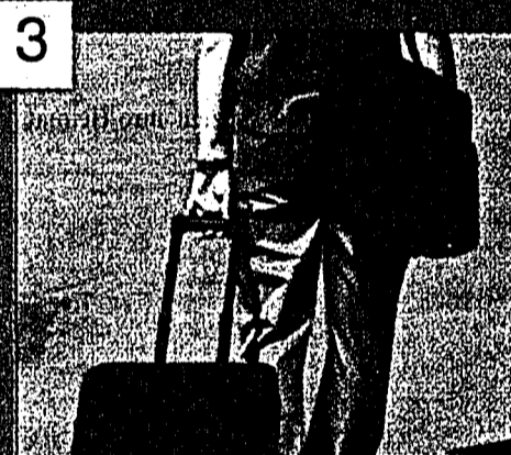
3 Reise-Set Aufpreis: CHF 49.-

Zigarren werden brüchig und verlieren ihr Aroma, wenn sie nicht mit der richtigen Feuchtigkeit gelagert werden. Zum Aufbewahren von Zigarren eignen sich daher am besten Humidore, die für die richtige Luftfeuchtigkeit sorgen. Diese Humidore enthalten je einen Hygrometer und Luftbefeuchter zum Regulieren der Luftfeuchtigkeit innerhalb des Humidors. Sie bestehen aus aussen beschichtetem Zedernholz. Die Fachaufteilung ist verstellbar, der Deckel mit versenkbaren Metallscharnieren versehen. Lieferung erfolgt ohne Zigarren. Masse: ca. B22 x T26 x H11 cm. Nr. 118 043-6