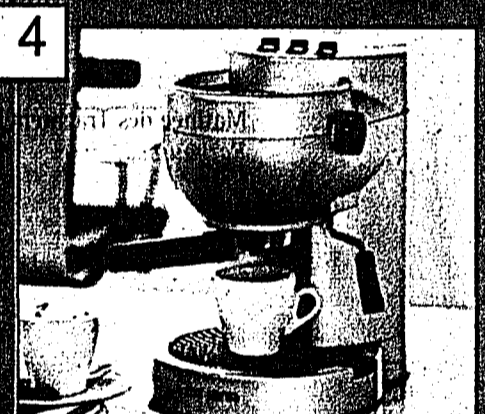
4 DE SINA Espressomaschine Aufpreis CHF 99.-

Reise-Trolley: Aus Rip-Stop Polyester gearbeitet, 1 ABS-Handgriff, 1 Reissverschlussvordertasche, mit umlaufendem Reissverschluss zu öffnendes Hauptfach. Innen: Packgurte, abnehmbare Strupptasche und im Deckel befindliche Reissverschlussstasche. Entspricht den neuen IATA-Abmessungen. Masse: ca. B35 x T22,5 x H50 cm. Und Reise-Umhängetasche: Aus Rip-Stop-Polyester gearbeitet. Innen: kleines Dokumentenfach mit Visitenkarten-Steckfächern, Adressfach und Schreibgeräteschlaufen. Seitlich je 1 Reissverschlussstasche, eine zusätzlich innen mit Handysteckfach. Rückseite gedoppelt zum Aufstecken auf Trolleygestell geeignet. Masse: ca. B40 x T15,5 x H32 cm. Nr. 089 756-6