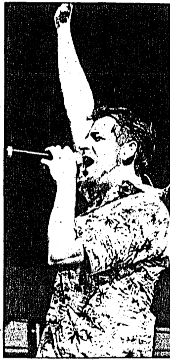
Rund 25 000 Musikbegeisterte werden dieses Jahr wieder am Southside-Openair erwartet. Neben Zelten ist gute Musik angesagt.

In Neuhausen ob Eck, einem kleinen Örtchen in der Nähe von Tuttlingen, findet heuer zum vierten Mal das Southside Festival statt. Ein Openair, das es in sich hat. Schon im letzten Jahr standen Musikgrößen wie Ash, Weezer, Placebo, Wheatus, Iggy Pop und Fünf Sterne Deluxe auf der Bühne. Dieses Jahr verspricht noch mehr: Garbage, Tocotronic, Such A Surge, No Doubt, Queens of the Stone Age (neu mit Ex-Foo-Fighter Dave Grohl!), Sportfreunde Stiller, Die Ärzte, New Order und die Red Hot Chili Peppers bringen garantiert Bombenstimmung. Liest sich das wie deine CD-Sammlung? Nichts wie hin. Aber wie? Wegbeschreibung, Programm, Mitfahrzentrale und viele andere nützliche Tipps und Informationen findest du auf der Internetseite http://www.southside.de . Dort kannst du auch die Tickets für zwei Tage Musikerlebnis bestellen oder erfahren, wo es welche zu erstehen gibt. Übrigens findet das Southside