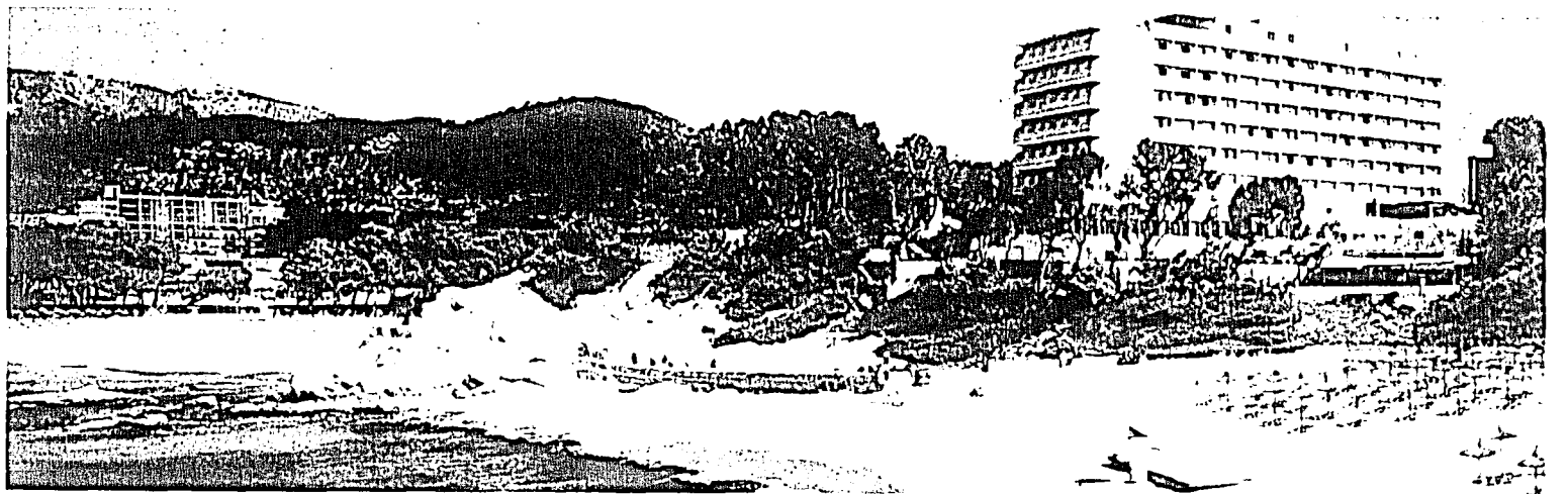
Auf dem Weg zu mehr Lebensharmonie. Mit dem Ferienseminar auf Mallorca verbinden Sie das Nützliche mit dem Schönen.