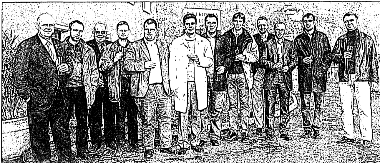
15 Busunternehmer aus Baden-Württemberg weilten für drei Tage in Liechtenstein.

Um sich einen Einblick in das Land zu verschaffen, besuchten die Teilnehmer am Donnerstag die Liechtenstein Bus Anstalt und liessen sich über das liechtensteinische Bussystem informieren. Auf einer geführten Landesrundfahrt, bei der Fahrt mit dem Ci-