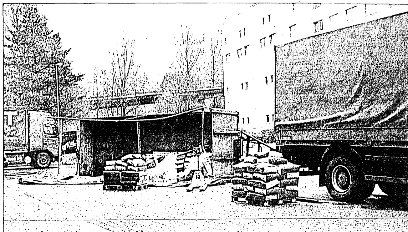
Gestern Vormittag kippte in Schaanwald der Anhänger eines LKWs um. Als der Lastwagen beim Gewerbezug wenden wollte, kam der Anhänger aus dem Gleichgewicht und stürzte auf die Strasse. Der Chauffeur stellte nach dem Unfall fest, dass der Anhänger einseitig beladen war. Am Anhänger entstand ein Sachschaden unbestimmten Grades.