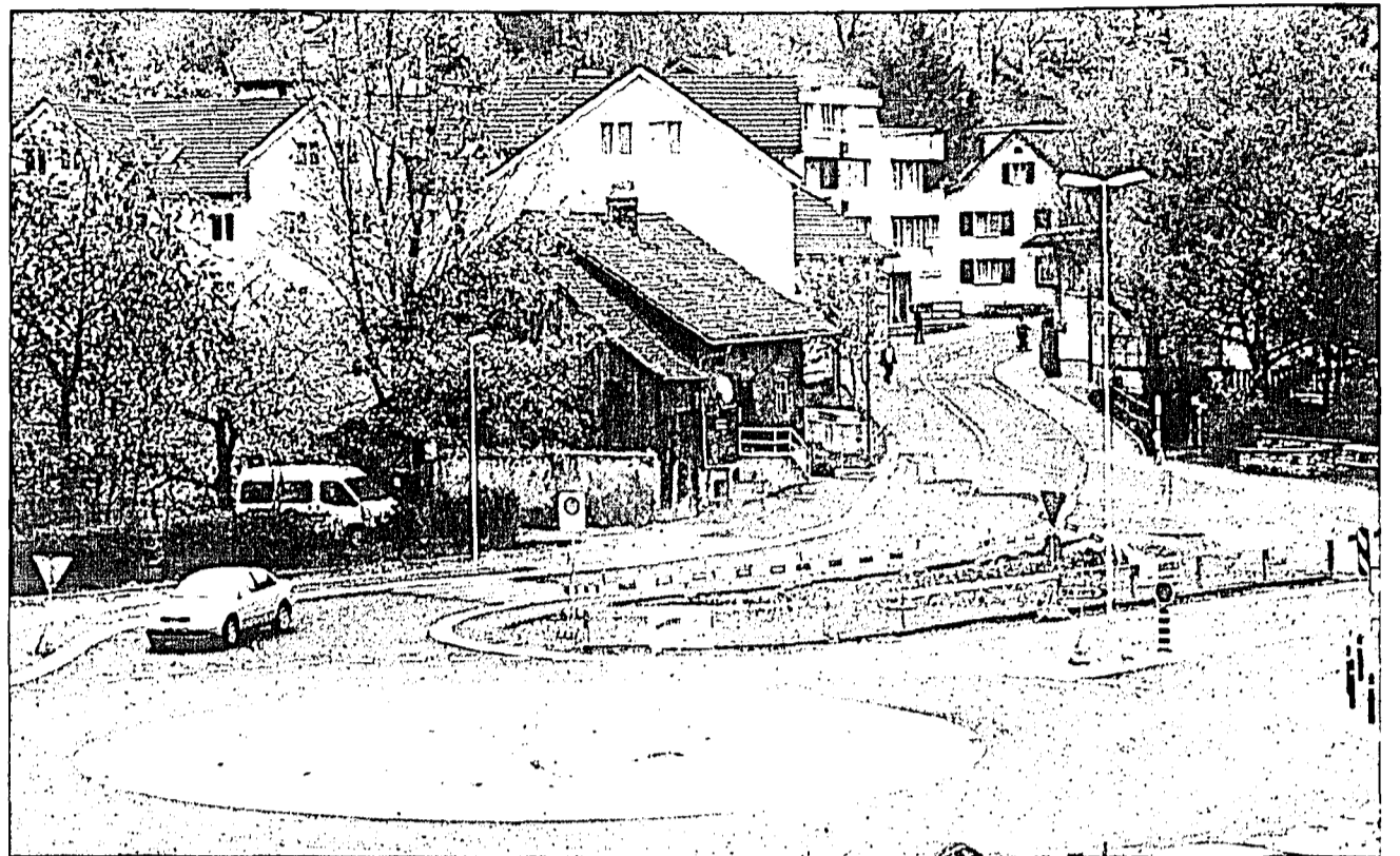
Mit einer Endgestaltung des Sonnenkreisels wird noch gewartet. Frühestens in ein oder zwei Jahren wird es soweit sein.

Für eine bestmögliche Ensemblegestaltung im Zentrum von Triesen hat die Regierung kürzlich eine Kommission einberufen. Der Triesener Sonnenkreisel wird sich somit frühestens in ein oder zwei Jahren in seiner endgültigen Fassung zeigen.