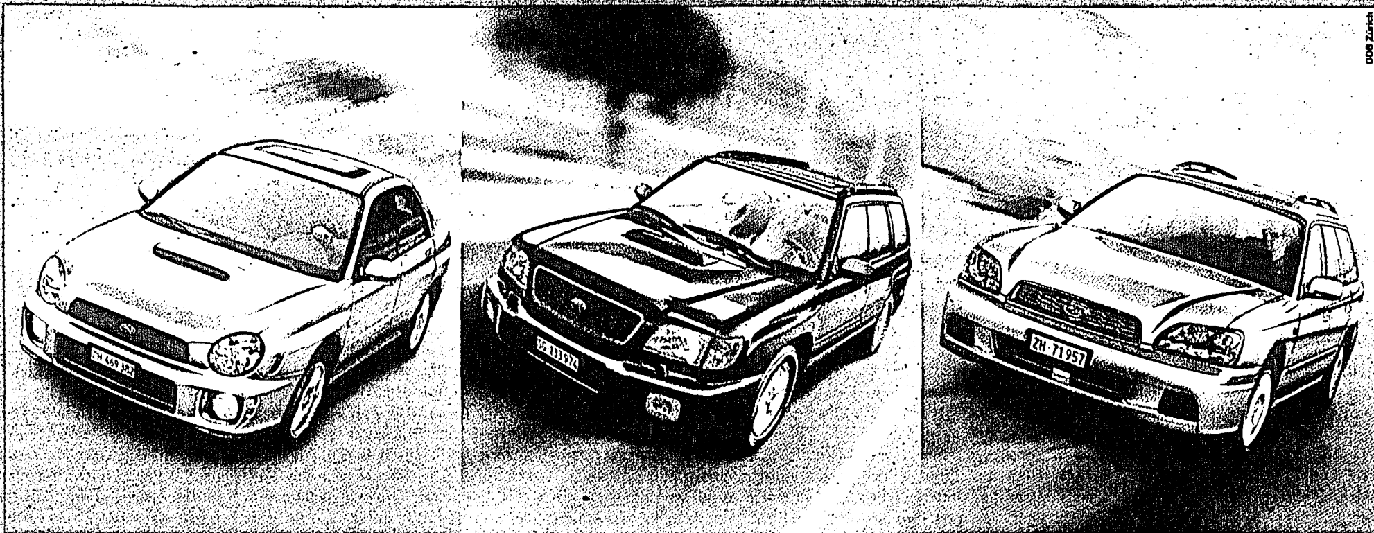
Impreza Turbo 4WD «WRX»; 4-türig, 2,0 l, 218 PS, Fr. 38'900.- netto