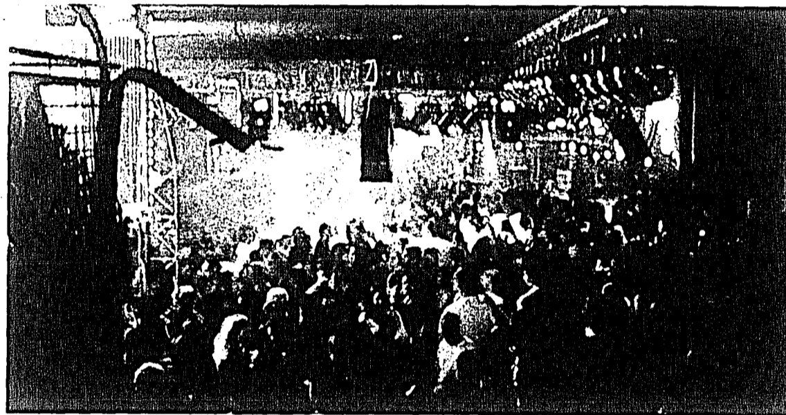
Wer gönnt sich nicht nach einem anstrengenden Arbeitstag die stressfreie Zone in der Bronx in Buchs?

Die Bronx ist ein multikulturelles Stadtteil in New York. Genauso multikulturell soll das Lokal sein.