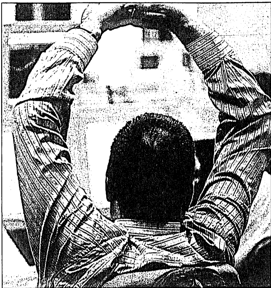
Frisch erholt aus den Ferien zurück und doch plagen bereits wieder hartnäckige Kopf- und Gliederschmerzen. Woran kann es liegen?

Wir wissen heute, dass die Erde gleich wie alle anderen Gestirne strahlt. Der Beweis ist auch erbracht, dass jedes Metall, jeder Stein und gar jedes Lebewesen ihre eigene Strahlung hat. Mit den bisher bekannten