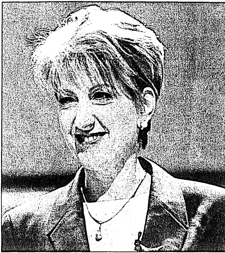
«Eine kleine, aber entscheidende Mehrheit.» Hewlett-Packard-Chefin Carly Fiorina hat gut lachen.

Compaq-Chef Michael Capellas hatte am Vortag in Houston gesagt, er rechne mit einer deutlichen Mehrheit zu Gunsten des Zusammenschlusses.