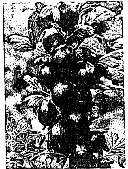
Mit der roten Stachelbeere ist der Dessort perfekt. Die Beeren kommen selbstverständlich erntefrisch vom Balkon.

Die richtige Mischung macht es aus. Während die bunte Blumenpracht zauberhaft verwandelt, sind die verschiedenen Nutzpflanzen mit ihren süßen Vitaminspendern die ideale Ergänzung dazu. Aus dem Augenschmaus wird bald einmal ein Reigen lustvoller Genüsse.