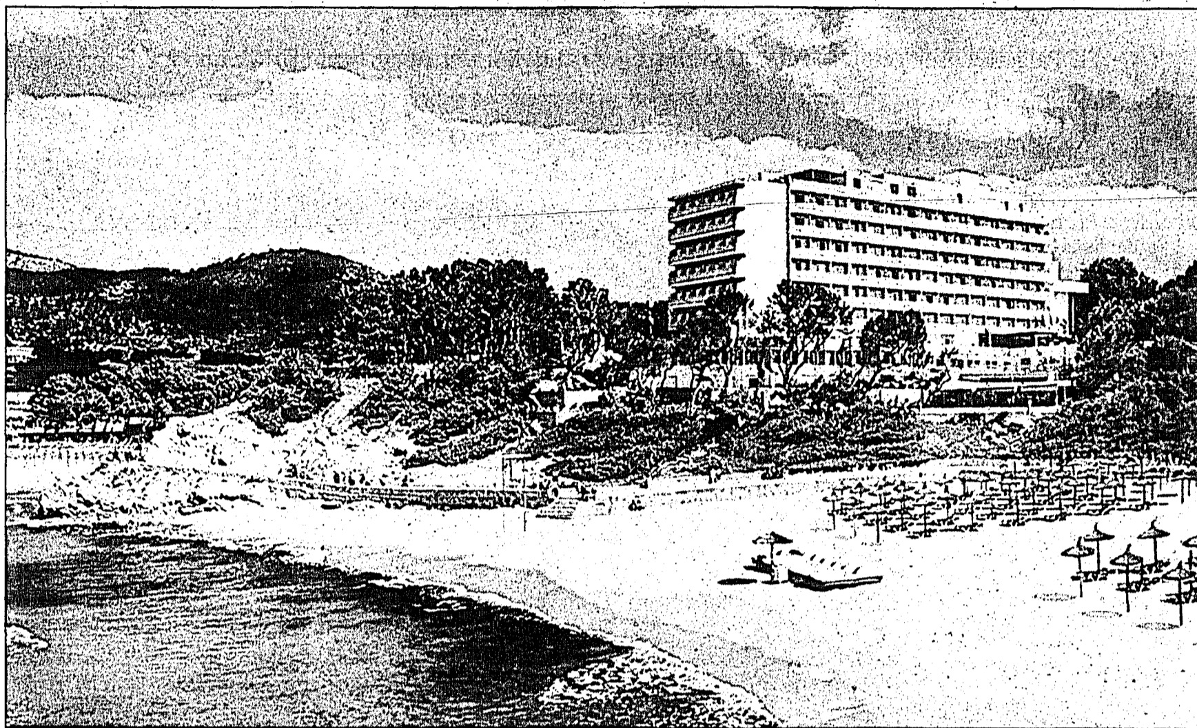
Jeder Besucher der Frühjahrs-Hausmesse der Delta Möbel in Haag kann zwei Wochen Ferien für zwei Personen von Universal-Flugreisen gewinnen.

Viele Stationen laden zum Verweilen und Probieren ein. So zum Beispiel eine Prosecco-Bar, eine Steamer-Vorführung von V-Zug und Gratis-Imbiss und Getränk in der Cafeteria. Wie alter Schmuck zu neuem wird,