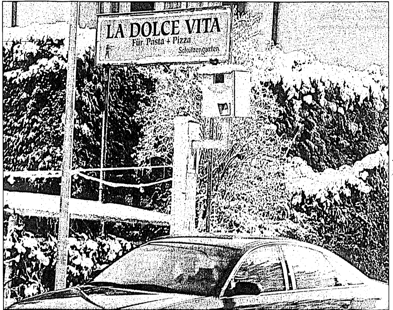
Noch blitzt es nicht, aber die neue Radaranlage an der Churer Strasse in Nendeln wird etwa Mitte des Monats in Betrieb genommen, wie die Landespolizei erklärt.