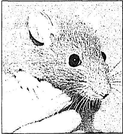
Eine Rattenmutter (7 Monate) und ihre drei Jungen (3 Monate) suchen ein gutes Zuhause.

Noch hat niemand seinen kleinen Hund, der am Anfang gerne mal in eine Ecke pinkelt, ins Tierschutzhaus gebracht. Die Zwergkaninchen, deren