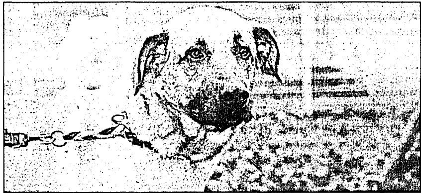
Speedy ist ein Rhodesian-Ridgeback-Mischling, geb. 1996, männlich. Er verträgt sich problemlos mit Menschen und mit Hündinnen. Speedy ist sehr lieb, aber temperamentvoll. Er braucht eine starke Hand. Speedy sucht einen hundeerfahrenen Menschen, der mit ihm eine Hundeschule besucht.