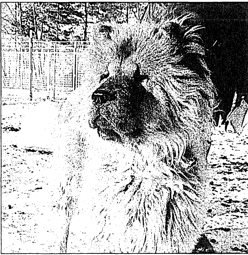
Vor kurzem erreichte dieser Chow-Chow das Tierschutzhaus. Der verwahrloste Hund irrte tagelang in Balzers umher, bevor ihn einige Anwohner einfangen und nach Schaan bringen konnten. Der Fund wurde bei der Polizei gemeldet. Bis jetzt gibt es noch keinen Anhaltspunkt, woher der reinrassige, junge Chow-Chow kommen könnte. Das Tierschutzhaus ist für jeden Hinweis dankbar. Wer kennt diesen Hund? Wer hätte Interesse, ihn bei sich aufzunehmen? Ein Chow-Chow ist ein Hund, der recht eigenwillig und stur sein kann. Seine Haltung ist nicht ganz einfach. Der in Balzers gefundene Chow-Chow sucht einen Besitzer mit Hundeerfahrung.

Im Tierschutzhaus in Schaan warten zahlreiche Hunde und Nagetiere auf ein neues Zuhause bei Menschen, die sich im Klaren sind, was es bedeutet, ein Tier zu halten. Wer sich für eines der Tiere auf dieser Seite interessiert, kann sich unter der Telefonnummer 239 65 65 im Tierschutzhaus melden. Die Tierheimleiterin erteilt gerne nähere Auskünfte.