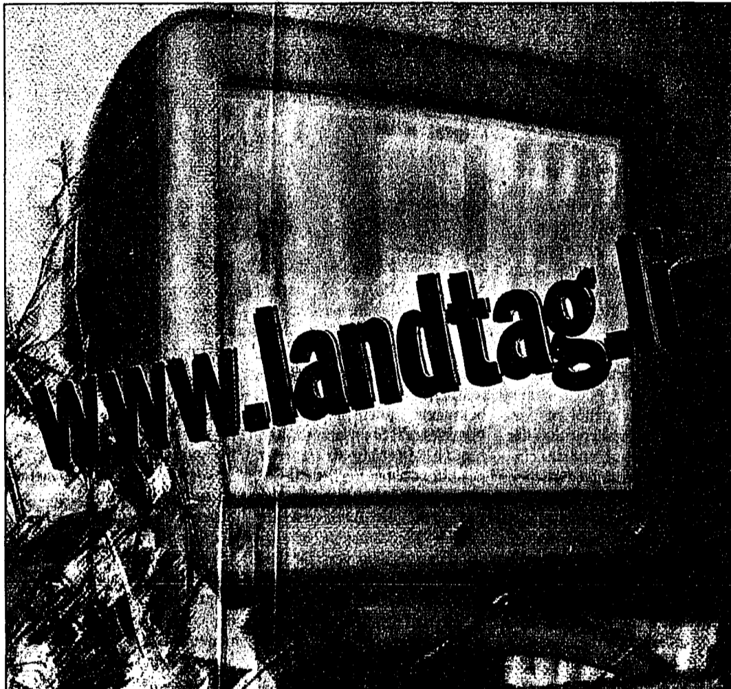
Ab heute im Internet verfügbar: «www.landtag.li» informiert bis am Sonntag über den Wahlmodus, während der Auszählung der Stimmen dann über die aktuellsten Zahlen.

Auf verschiedenen Bildtafeln werden die Resultate aus den beiden Wahlkreisen und den einzelnen Gemeinden unmittelbar nach der Auszählung der