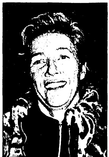
Hanni Weirather-Wenzel, Ex-Skirennläuferin.