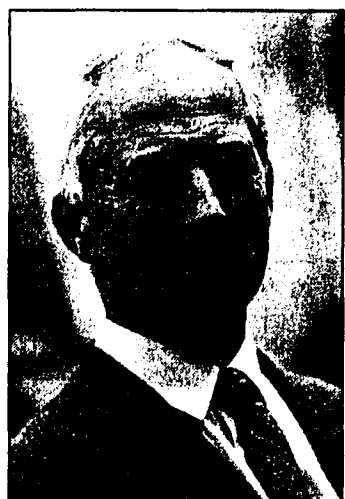
S. D. Fürst Hans-Adam II.