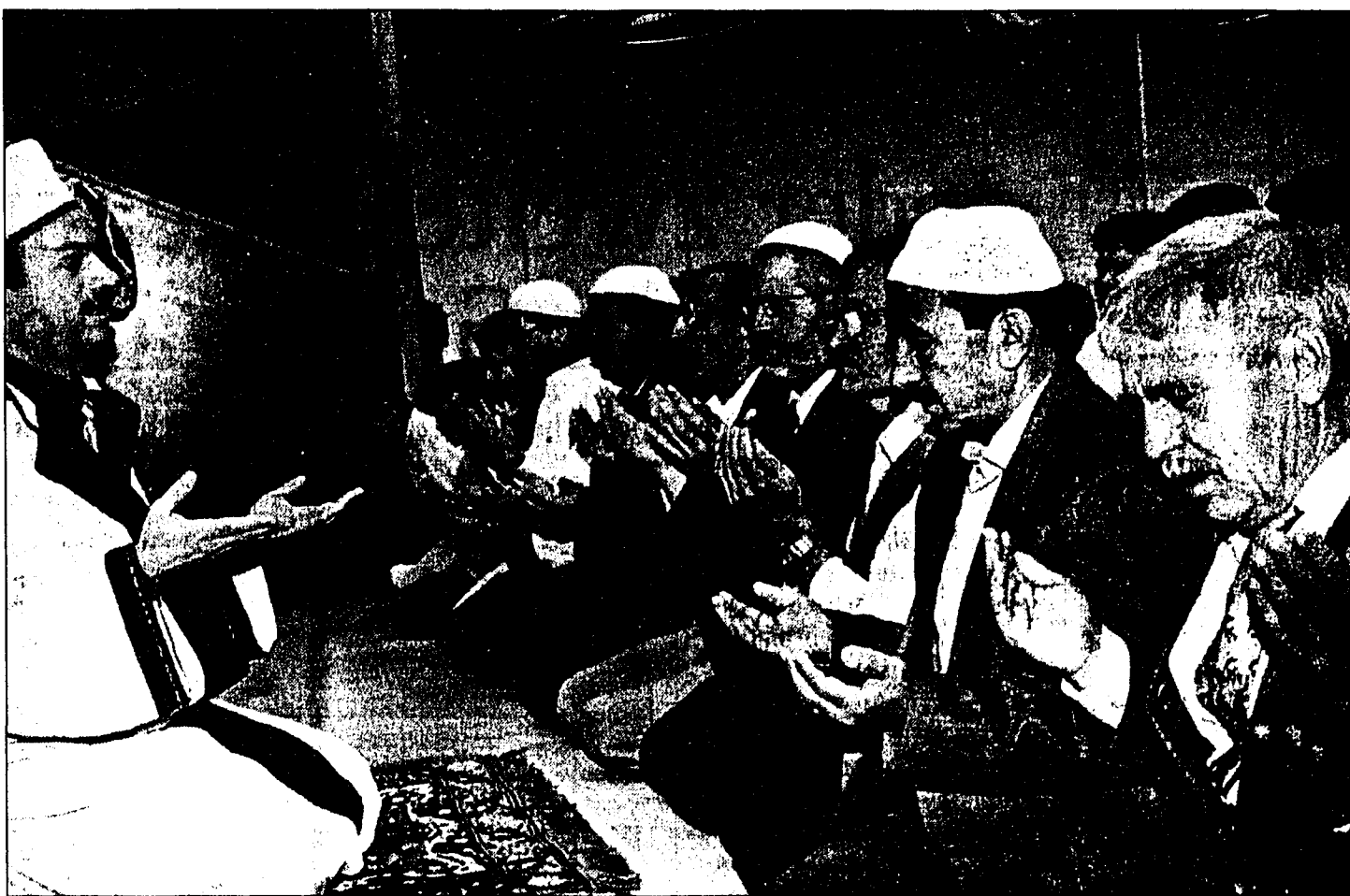
Der Ramadan wurde gestern mit einem Gebet vom Imam (Vorbeter, links im Bild) und einem anschliessenden Aperitif feierlich beendet.

Daneben hat das Fasten vielfältigen Nutzen: Unter anderem lehrt es Selbstbeherrschung, befreit aus der Abhängigkeit von der Macht der Gewohnheit und lässt den Menschen stattdessen anpassungsfähig in seinen Gewohnheiten werden. Es erweckt bei denen, die gewohnt sind, in Wohlstand und Überfluss zu leben, Verständnis und Mitgefühl für jene, für die Hunger und Durst alltäglich sind. Und es lehrt den Fastenden, dass seine Kraft nicht allein von warmen Mahlzeiten abhängt, sondern auch von innerer Stärke durch Rückbesin-