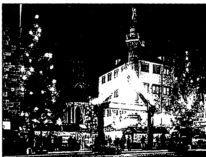
Weihnachtliche Stimmung in der Stuttgarter Innenstadt. Der Weihnachtsmarkt dauert noch bis 23. Dezember.

Traditionell dauert der Stuttgarter Weihnachtsmarkt mit der Budenstadt vom bis 23. Dezember. Auf dem Grossen Schlossplatz, nur rund fünf Minuten Fussweg vom Hauptbahnhof entfernt, ist das zauberhafte «Märchenland» für die kleinen Besucher aufgebaut. Zwischen Königsbau und Neuem Schloss stehen zahlreiche Attraktionen wie nostalgische Kinderkarusselle, ein Riesen-