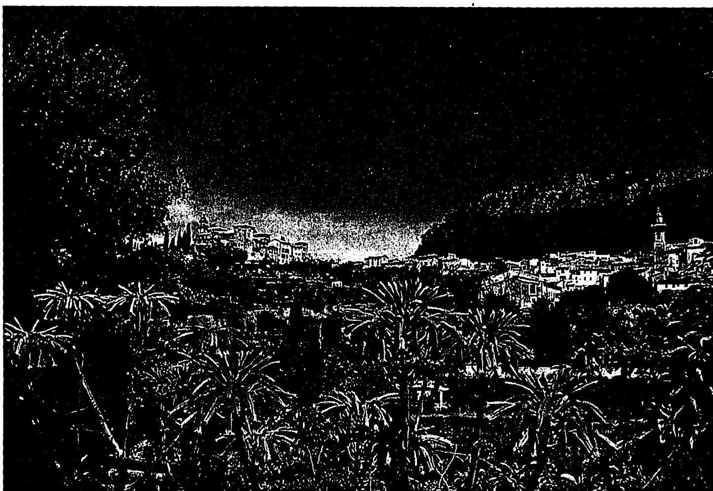
Mallorca bietet zahlreiche interessante Ausflugsmöglichkeiten. So auch die Kartause im romantischen Bergort Valdemossa, wo der Komponist Frédéric Chopin einige Zeit lebte.

Doch nicht nur Badeferien, gemütlich am Strand liegen