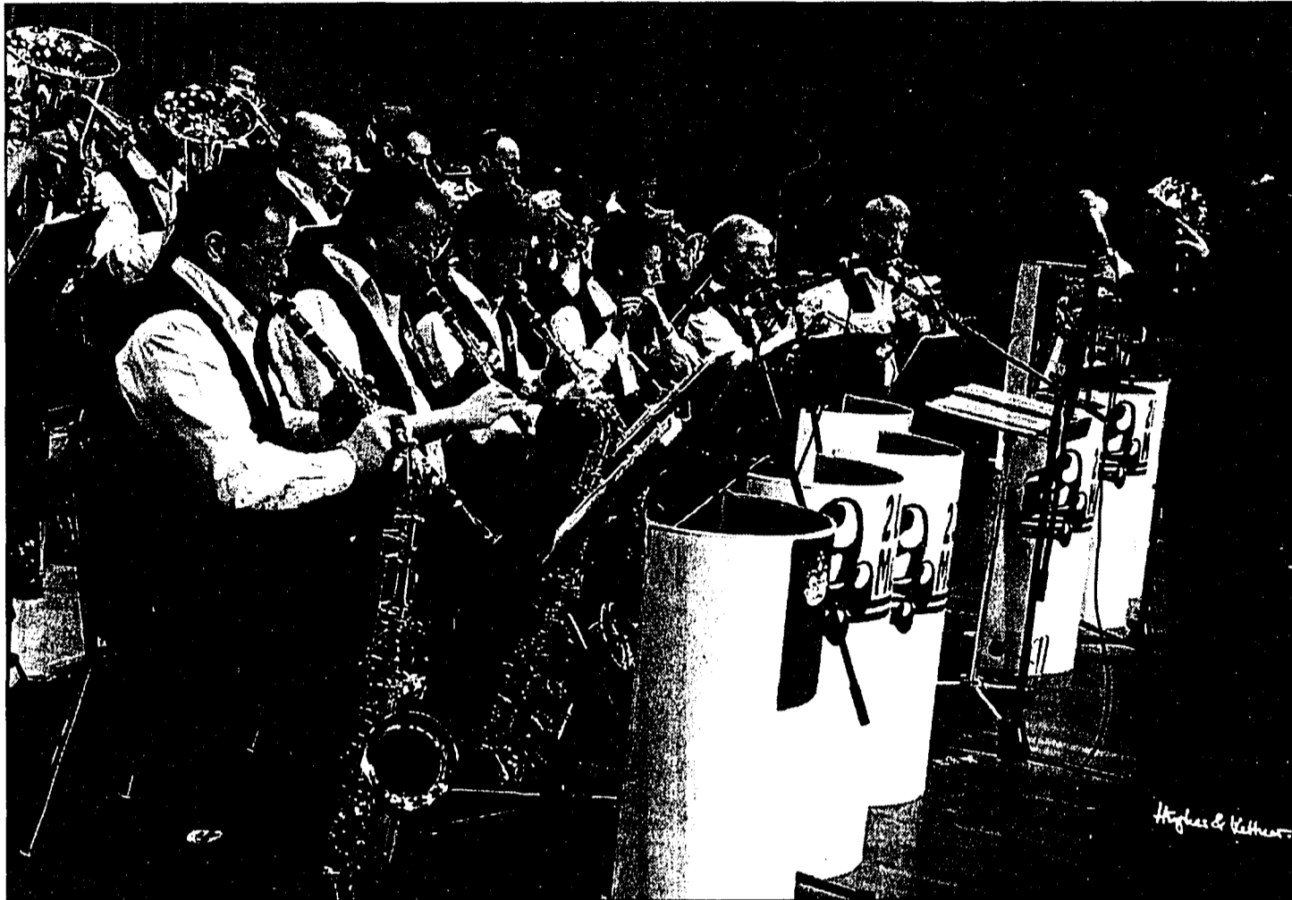
Unter dem Motto Weltreisen luden die 2-Länder-Musikanten gestern zu ihrem Konzert 2000 in Triesen ein.

Ein Konzert mit internationalen Musikspezialitäten