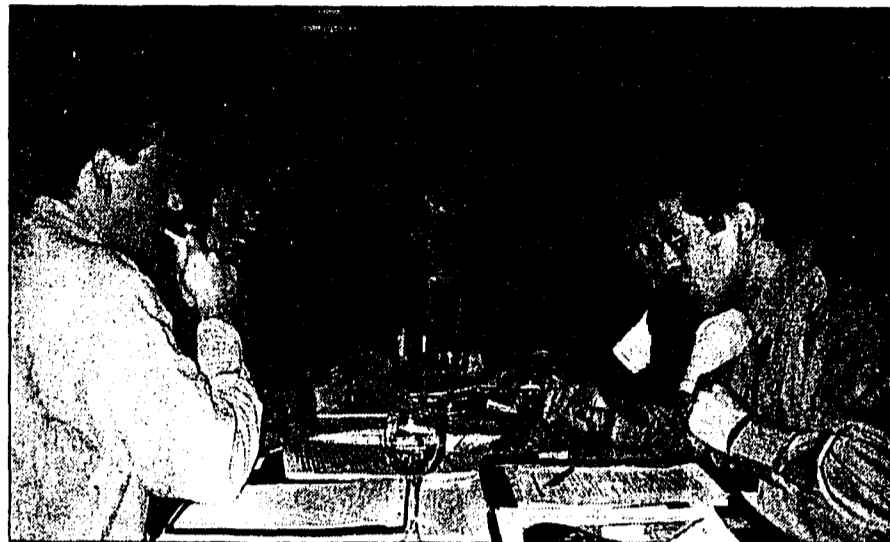
An einer ganztägigen Klausurtagung in Schellenberg fixierte das Kandidatenteam der Bürgerpartei am Wochenende die Grundzüge seines Wahlprogramms.

Das FBP-Programm der Zukunft nimmt Gestalt an. An einer ganztägigen Klausurtagung in Schellenberg fixierte das Kandidatenteam der Bürgerpartei am Wochenende die Grundzüge seines Wahlprogramms. Am Parteitag vom 8. Januar wird dieses zukunftsweisende Programm vorgestellt.