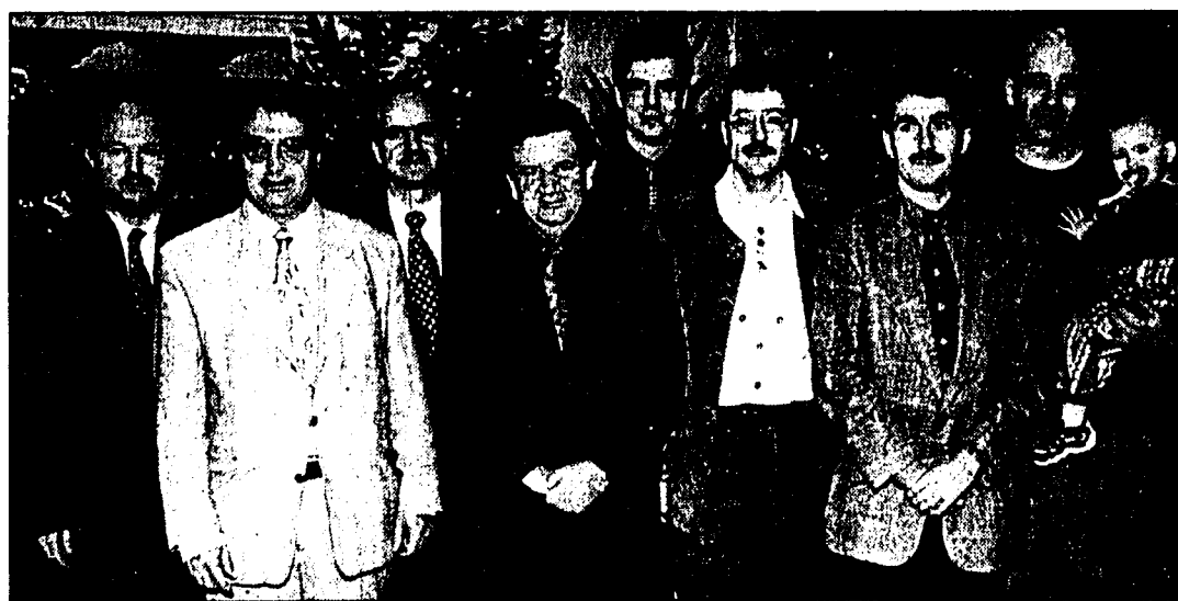
Die geladenen Gäste zeigten sich begeistert über die schöne Ausstellung.

11. Weihnachtsmarkt wurde gestern Abend eröffnet