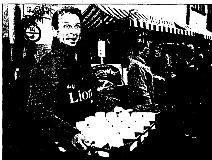
Tausende Besucher eröffnen beim «Blosengelmarkt» vom 24. und 25. November einen Monat «Feldkirch im Advent» mit zahlreichen Veranstaltungen.

Zu den rund 50 Ständen mit originellen Geschenkartikeln gesellen sich 20 Stände zwischen Schmiedgasse, Schlossergasse und Marktgasse, die von Glühwein und Glühmost