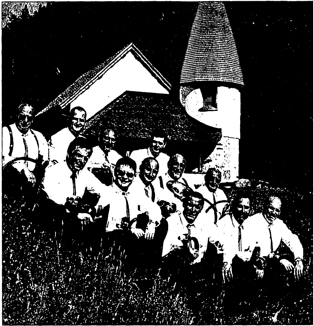
Die Jagdhornbläsergruppe der liechtensteinischen Jägerschaft feiert ihr 40-jähriges Bestehen am Samstag, den 25. November in der Pfarrkirche Vaduz mit einer Jägermesse.