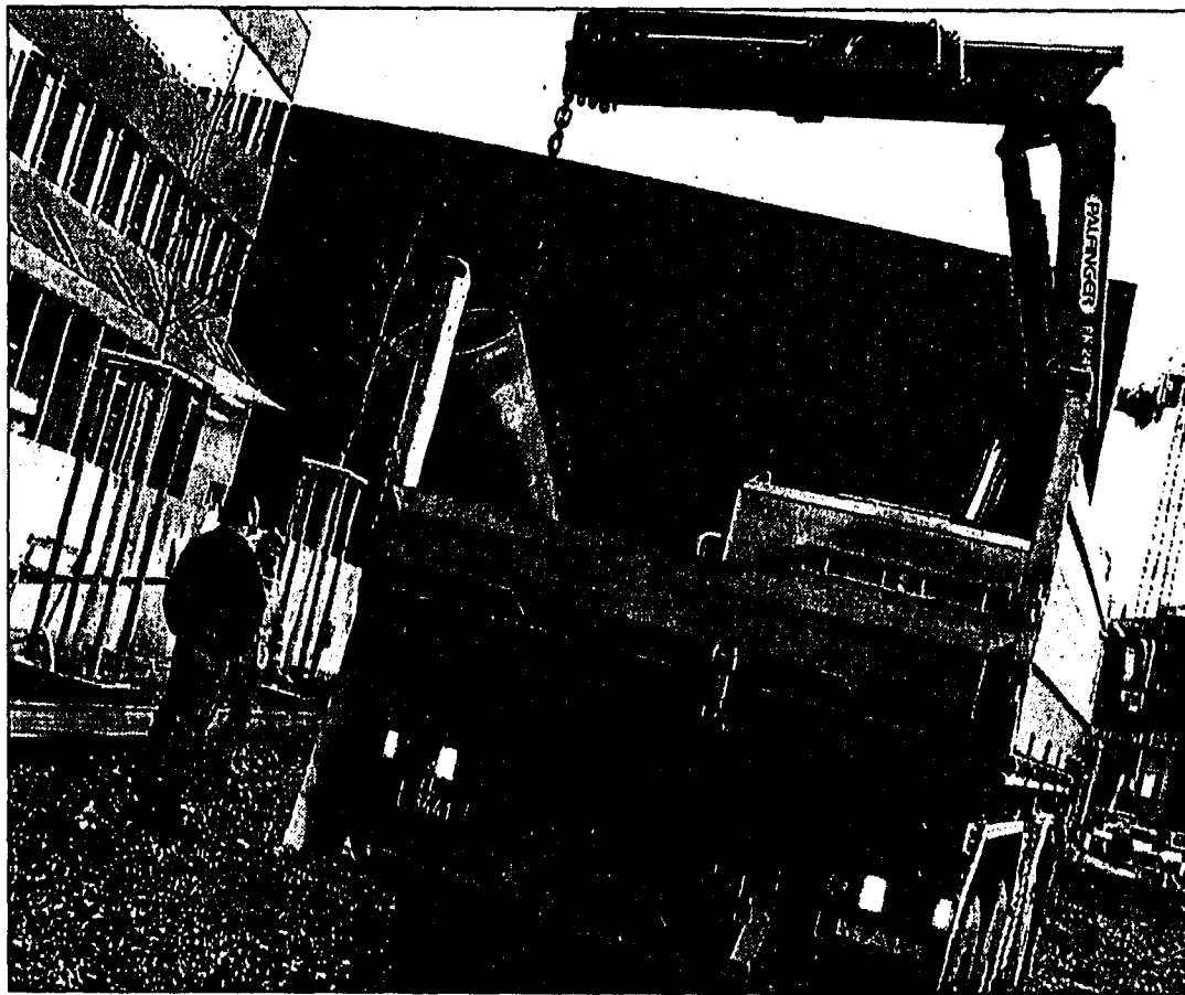
Ist das Zentrum von Vaduz auf dem Weg, ein Bankenviertel zu werden und entwickeln sich die Nachbargemeinden Schaan und Triesen zur Agglomeration? (Archivbild)