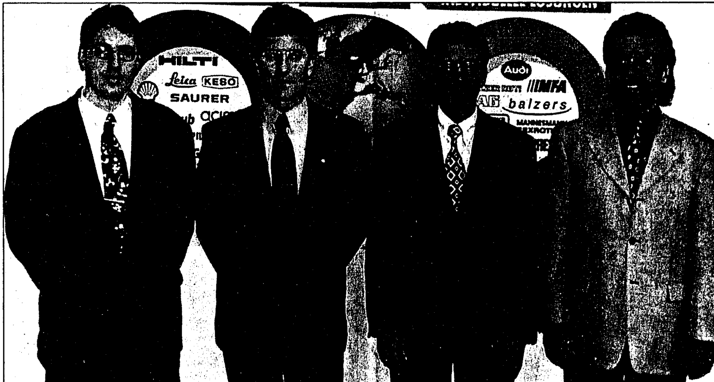
Wir hoffen, an der SWISSTECH viele unserer Kunden begrüßen zu können und natürlich auch neue Kontakte zu knüpfen, in jedem Fall wollen wir durch unsere Dienstleistungen und Produkte überzeugen.

Der Messeauftritt dieser Klein- und Mittelbetriebe aus unserem Lande erfolgt an einem attraktiv gestalteten Gemeinschaftsstand. Eine der neun Firmen ist die MESSTECHNIK AG in Triesen. Zum wiederholten Male treten wir in dieser Gemein-