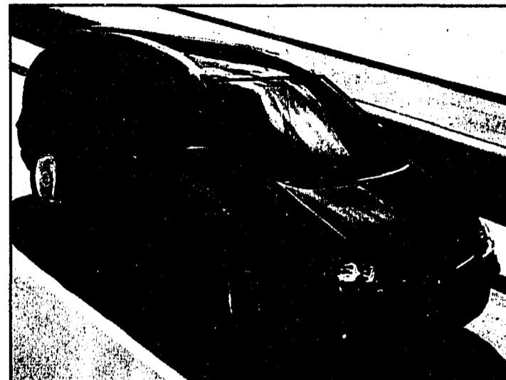
Der Almera Tino beweist seine Vielseitigkeit auch mit einer sinnvollen Einrichtung wie Gepäckboxen, die Sie aus dem Wagen herausheben und mitnehmen können.

der Zweiliter-Version. Nissan rüstet den Almera Tino mit zunächst drei unterschiedlichen Motoren aus: Die beiden Vierzylinder-Benziner in moderner Vierventil-Technik mit 1,8 und 2,0 Liter Hubraum leis-