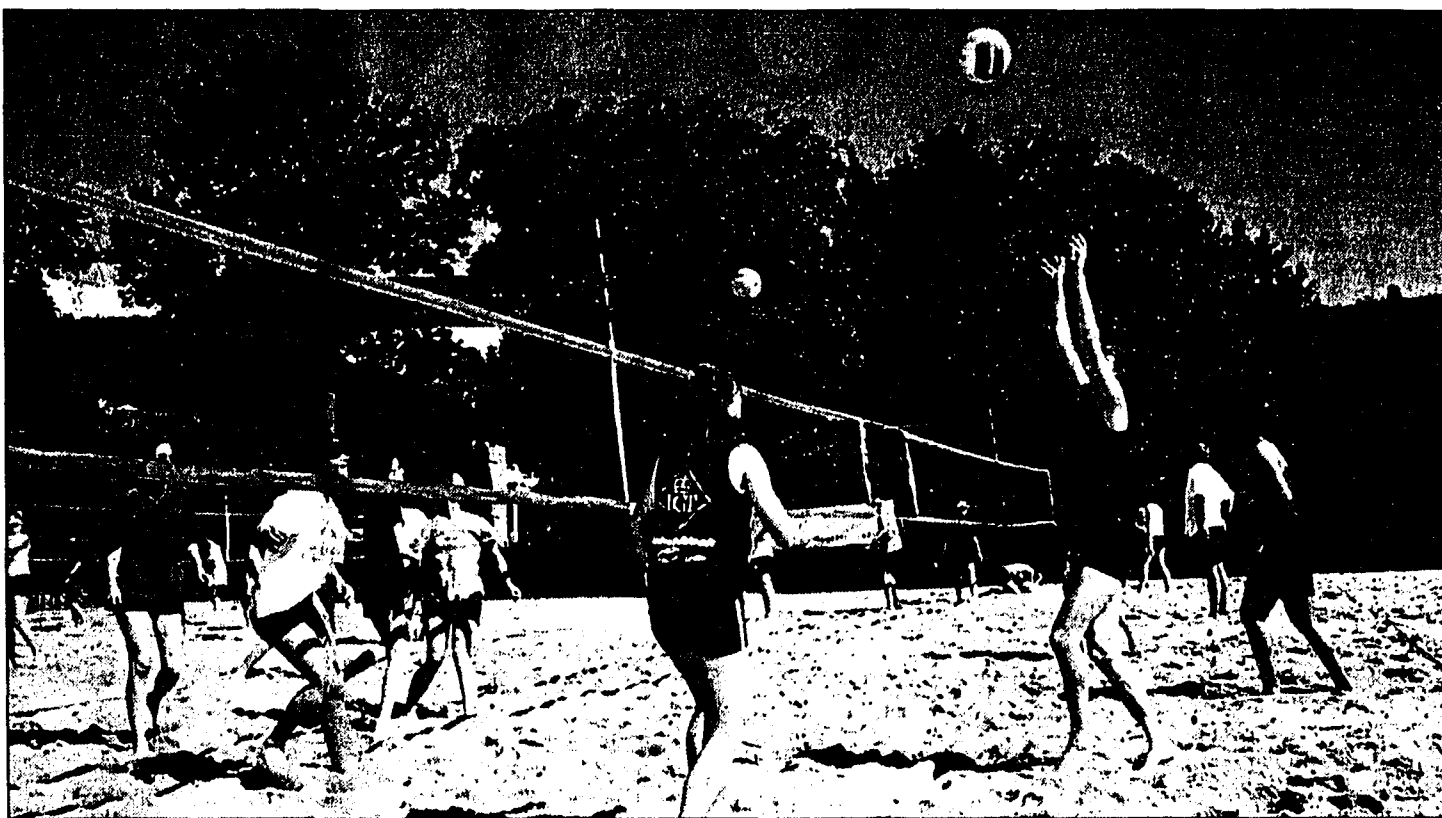
Der FBP-Beachvolleyball-Plausch am Samstag in der Freizeitanlage Mauren verspricht viel Sport und Spass.

Die Mannschaften stehen, der Spielplan ist perfekt ausgear-beitet, die Männer und Frauen am Grill und an der Geträn-kekeke gut bestückt, die Beach-volleyballanlage herausge-putzt, die Bälle gerichtet und mit den über 25 jungen Spiele-rinnen und Spielern ist Volley-ballplausch pur angesagt. Der gesamte Beachvolleyball-Plausch wird auch für die Zu-schauerinnen und Zuschauer, Fans und Freunde interessant gestaltet, da zuerst in zwei Ger-