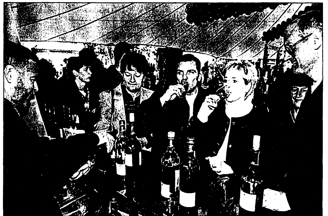
Wie im vergangenen Jahr (unser Bild) werden Winzer aus mehreren Gemeinden ihre Produkte beim Winzerfest am kommenden Samstag vorstellen. (Archivbild)

Wie im vergangenen Jahr werden Winzer aus mehreren Gemeinden ihre Produkte am Winzerfest vorstellen. Dem Publikum wird neben Informationen über den Weinbau in Liechtenstein, Musik und Unterhaltung insbesondere ein breites Angebot an heimischen Weinen präsentiert. Nach dem Kauf eines «Winzerfest»-Glases sowie Degustationsbons kann das Publikum sämtliche vorgestellten Weine degustieren und