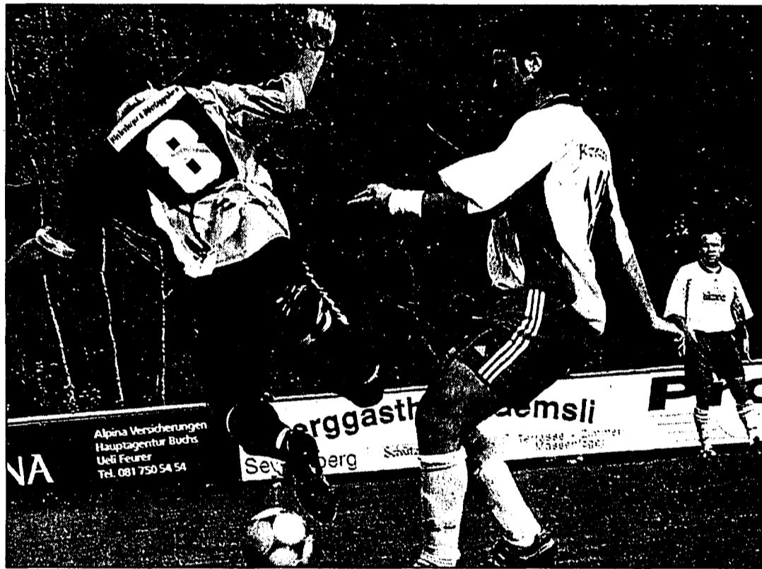
In einer ansprechenden Partie musste sich der FC Schaan in Spitzenspiel der 3. Liga nur knapp geschlagen geben

Die Ausgangslage der Schaaner vor dem Spiel war klar: Würde man beim FC Buchs drei Zähler einfahren, hätte man mit dem Leader punktemässig gleichgezogen und sich oben endgültig eingenistet. Dementsprechend legte die Frommelt-Truppe auch los: Bereits nach einer Viertelstunde konnten die Gäste zwei gute Torchancen für sich verbuchen, ein Tor wollte aber nicht fallen. Mit ihrem ersten Angriff zeigten dann die Buchser, warum sie in der Tabelle ganz oben stehen, denn wie aus heiterem Himmel zapelte der Ball in den Maschen