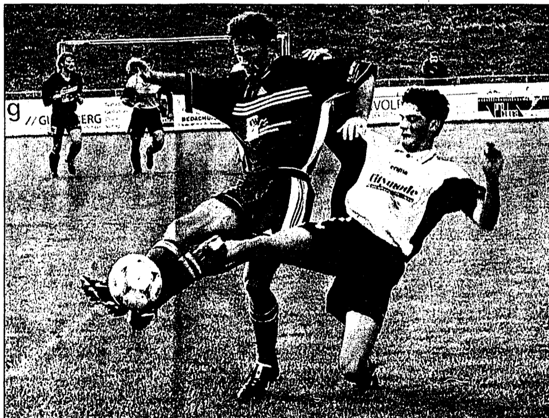
Trotz Feldüberlegenheit verlor der FC Ruggell gegen Diepoldsau mit 2:3.

von Schraner konnte dieser nur gestoppt werden und Sprenger noch mittels Foul im Strafraum verwertete den Strafstoss sicher zum Ausgleich. Engagierter gingen die Rug-