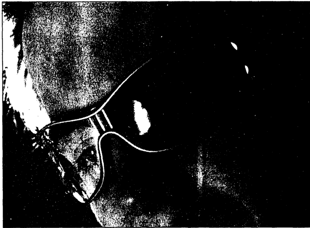
Trendsetter: Schutz vor UV-Strahlung und optimal geeignet bei wechselhaftem Wetter.

Was den Blendschutz anbetrifft, so kann man sich getrost auf das eigene, subjektive Empfinden verlassen. Bei starkem Gegenlicht oder schneebedeckten Pisten stossen Gläser in hellen Farben