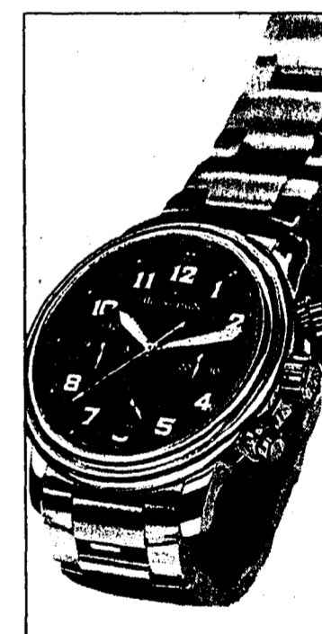
Mit der typischen Blancpain Lünette mit Saphirglas besticht der Chronograph durch sein Design.

Flyback, dem Innovationstalent ihrer Uhrmachermeister.