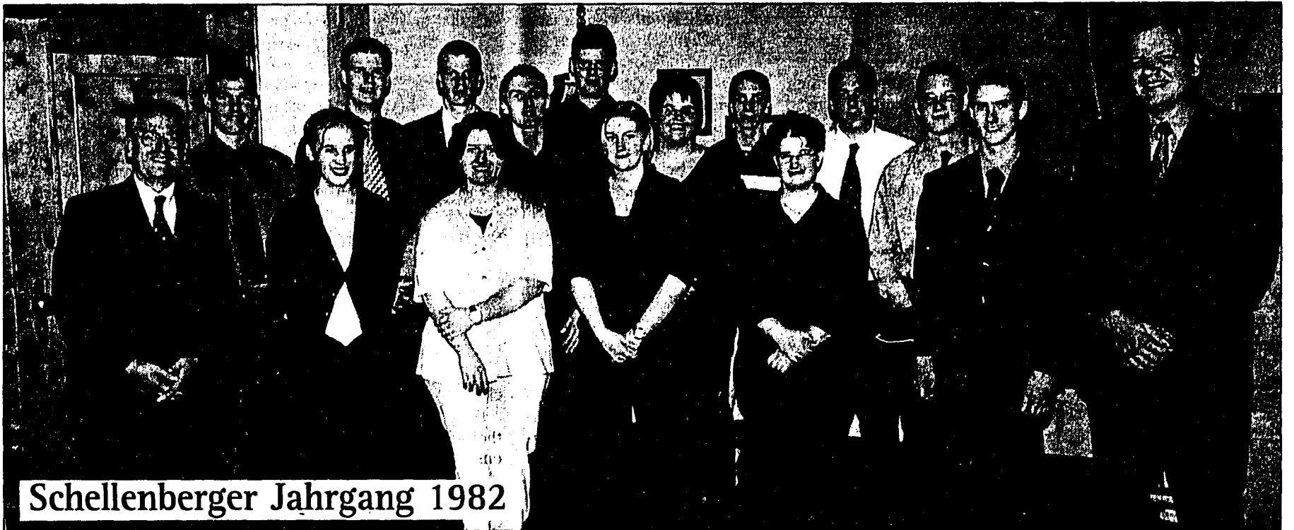
Schellenberger Jahrgang 1982