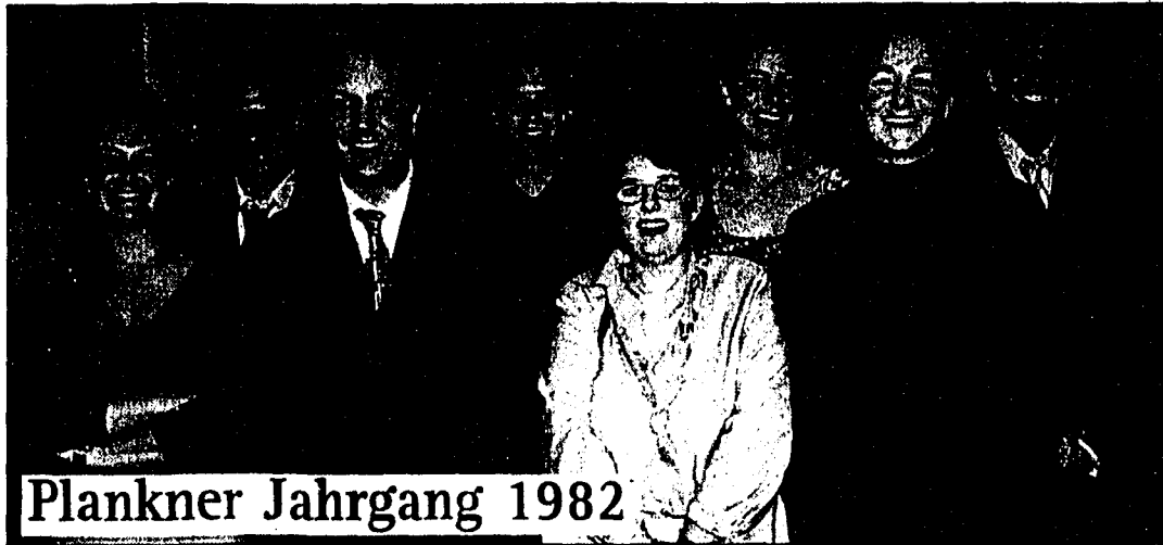
Plankner Jahrgang 1982