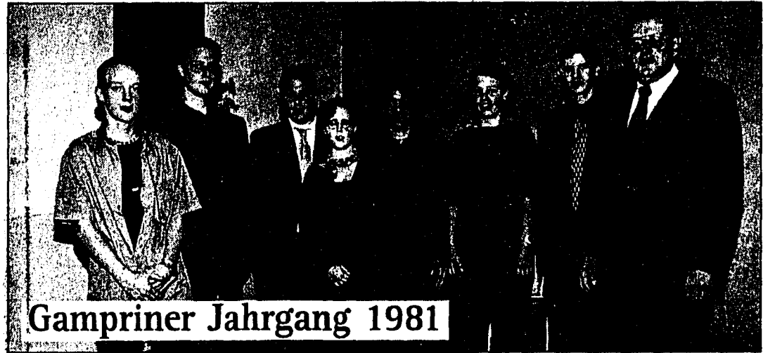
Gampriner Jahrgang 1981