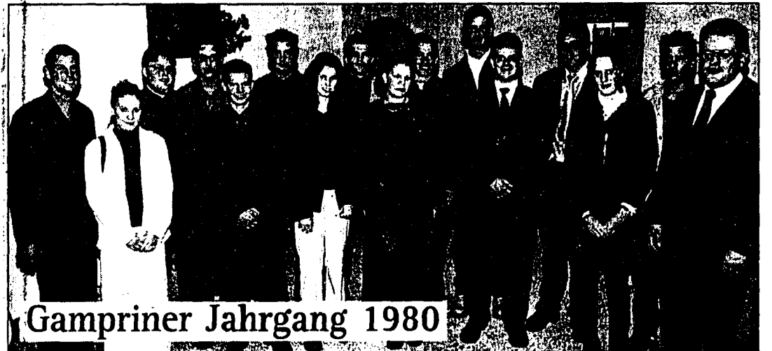
Gampriner Jahrgang 1980