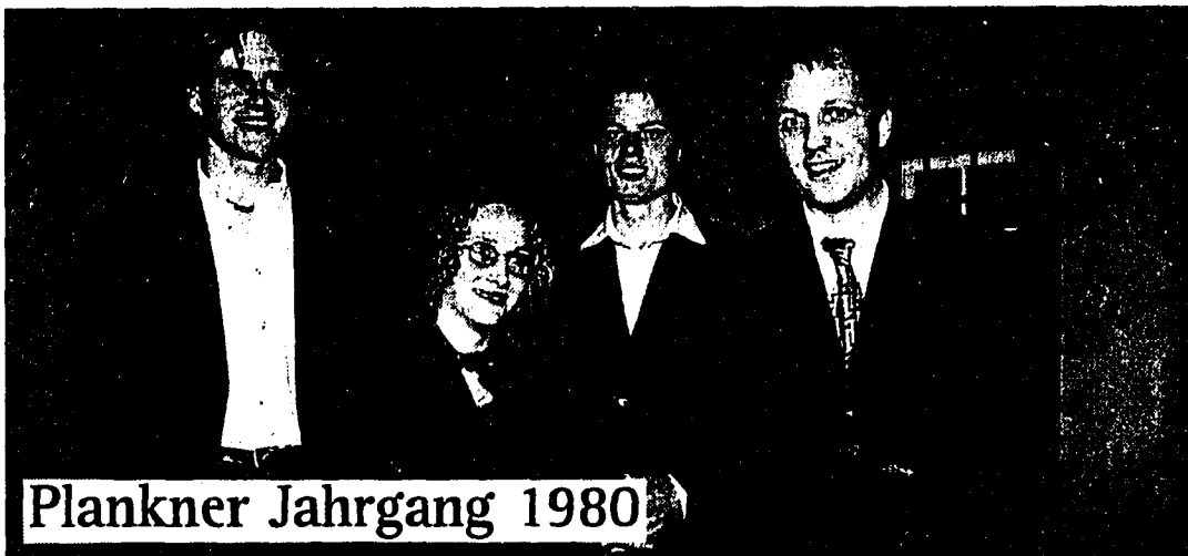
Plankner Jahrgang 1980