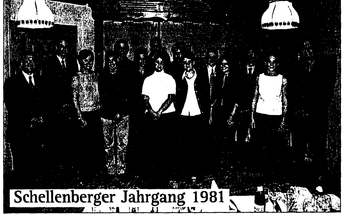
Schellenberger Jahrgang 1981