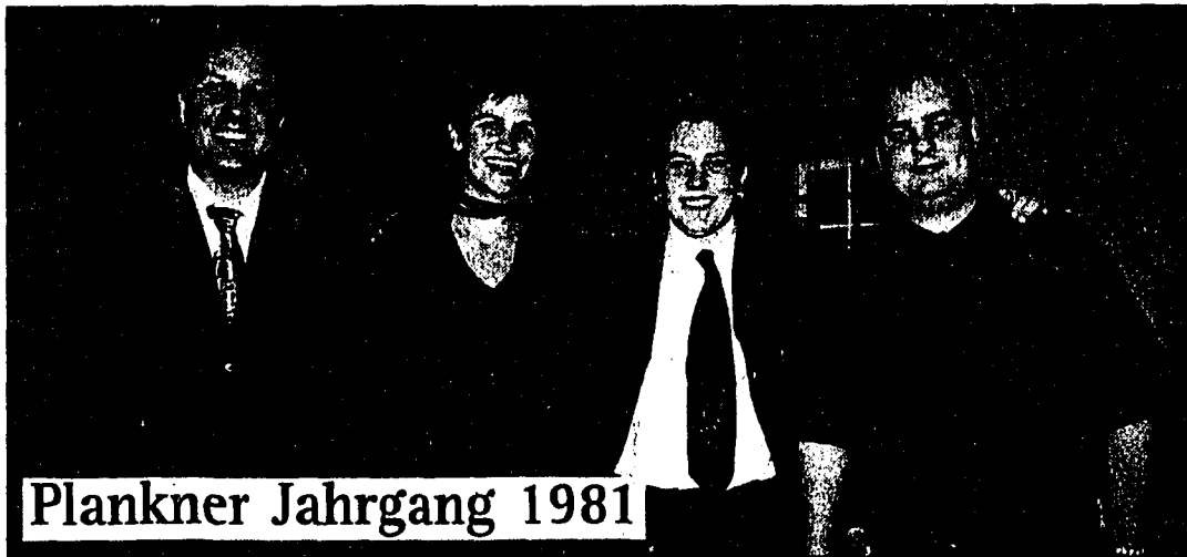
Plankner Jahrgang 1981