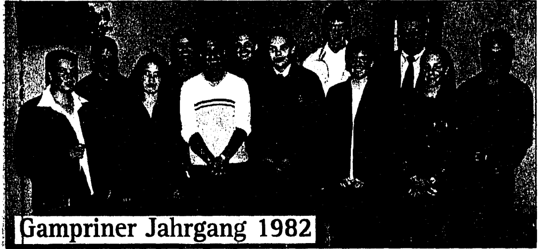
Gampriner Jahrgang 1982