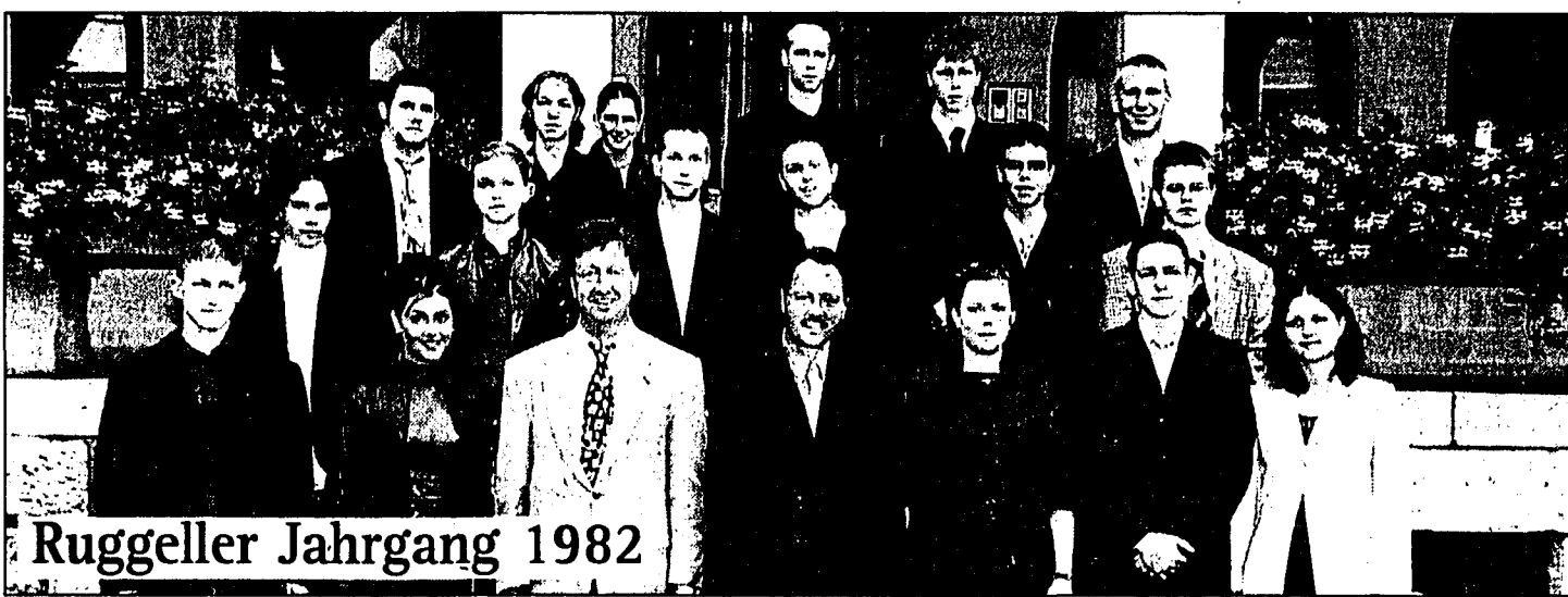
Ruggeller Jahrgang 1982

Der Anlass des Landes und der Empfang im Schloss fanden an zwei verschiedenen Tagen statt. Die meisten Gemeinden des Landes nutzten die Gelegenheit, ihre gemeindeinterne Feier, zu der auch die ausländischen 18- und 20-Jährigen eingeladen waren, ebenfalls am Tage des Schlossbesuches ab-