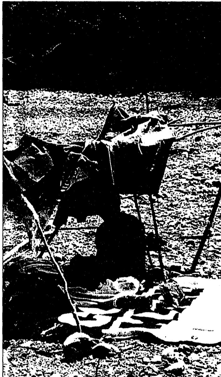
Natürlich brauchte es zwischendurch auch Ruhepausen.