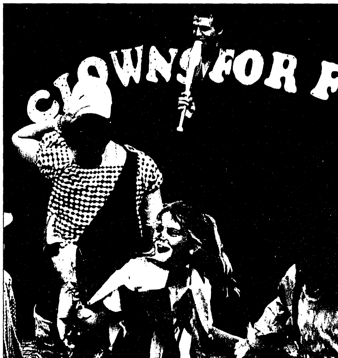
Ausgelassene Stimmung herrschte bei den Kindern, die spielerisch viel lernten.