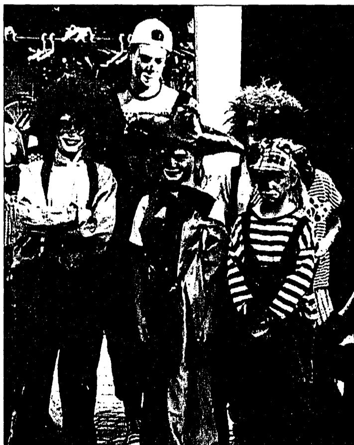
Perfekt geschminkt, ging es an die freudvolle «Arbeit».

Auch nächstes Jahr wollen wir den Kindern wieder einen abwechslungsreichen Sommer bieten – mit neuen Angeboten und vereinfachter Anmeldung soll der Sommer 2001 für Kinder und Eltern, Spass garantieren! (aha)