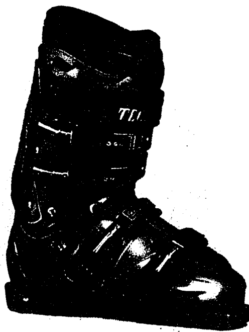
Das Spitzenmodell TNZ Icon Carbon von Tecnica überzeugt unter anderem durch seine austauschbaren Manschettenteile.

Veloce der sportliche Rodler in anthrazit, blau und gelb. Der Preis zwischen 329 und 349 Franken. Weitere Infos über das stärkste Ding auf Kufen bei der Firma Brüggli in Romanshorn, Telefon: 071 / 466 94 94 oder www.leggero.com