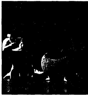
Lova-Möbel präsentiert neue Designlinien von de Sede und Leolux.