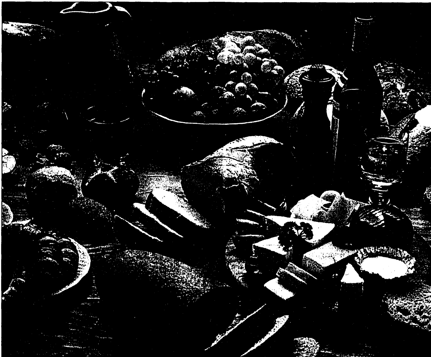
«Frei von Zusatzstoffen und Genmanipulation» ist mittlerweile ein ernst zu nehmendes Argument. Ein Restaurant kann sich damit schmücken, seine Menues ohne sogenannten «E-Nummern» herzustellen.

Die Beurteilung der gesundheitlichen Unbedenklichkeit ist schwierig. Wechselwirkungen zwischen den einzelnen Zusatzstoffen, Rückständen, Verunreinigungen und natürlichen Inhaltsstoffen sind noch weitgehend unbekannt. Wenig erforscht sind ebenso mögliche Wechselwirkungen mit Medikamenten. Diese Stoffe sind weder generell gesundheitsschädlich noch unbedenklich. Jeder Zusatzstoff muss einzeln nach dem