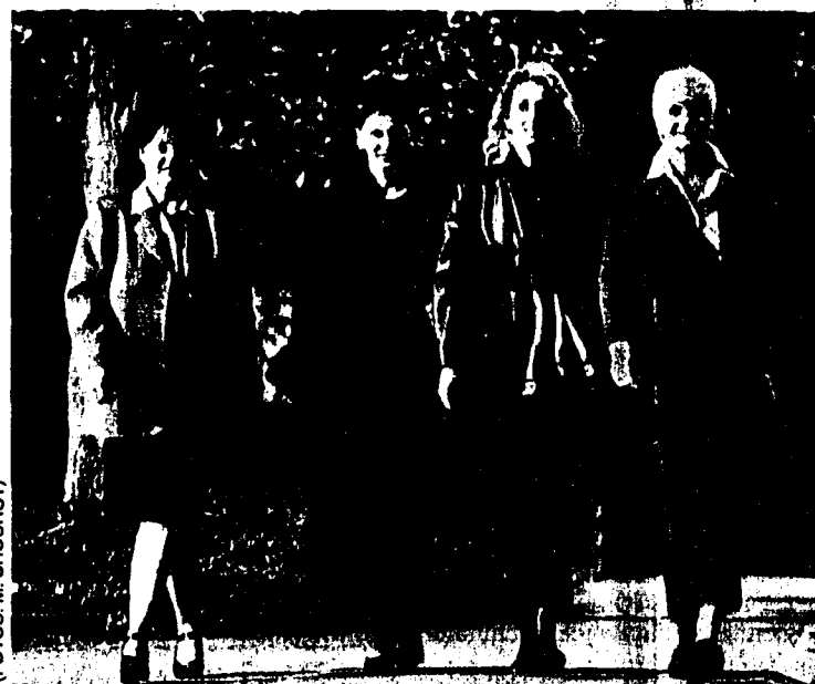
Selbstbewusst und jugendlich - so kann sich die Frau von heute mit der neuen Delmod Kollektion in Gr. 38 bis 50 von ihrer besten Seite zeigen.

Die Jacken sind aus weichem Wolf-Cashmere, Amaretta und Belseta sowie aus glatten Techno-