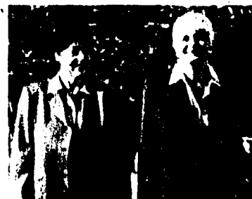
Topmodisch: Blazer in Tweed und feinen Wollqualitäten.

weichfliessenden Stoffen zu jedem Anlass kombinieren lassen, runden die gelungene neue Delmod-Kollektion noch so richtig ab. Kräutler.Mode.Bewusst.Sein. in Götzis: Im September und Oktober. Jeden Freitag Abendverkauf bis 20 Uhr!