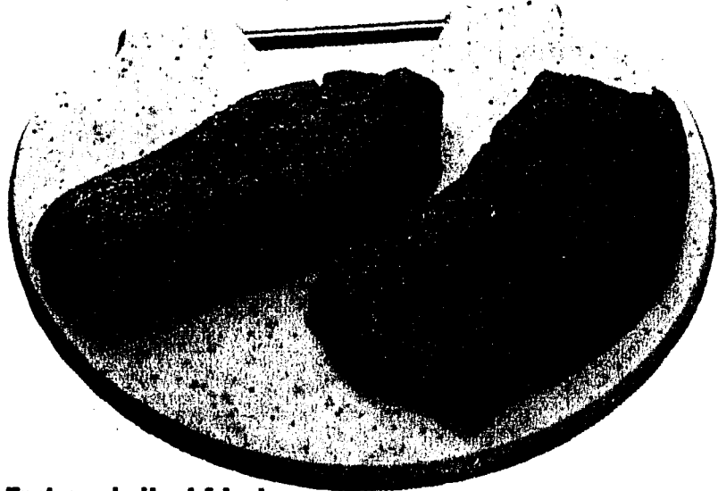
Trutenschnitzel frisch Import, per kg