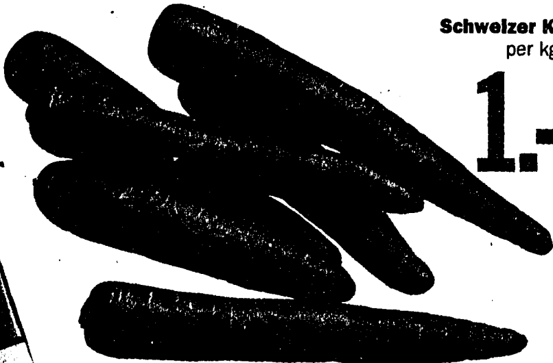
Schweizer Karotten per kg