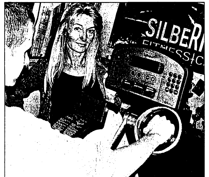
In der Halle 3, gleich beim Eingang kann die persönliche Fitness getestet werden.