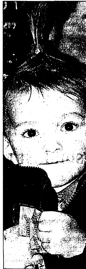
Die kleine Besucherin genießt die Gummibärchen.