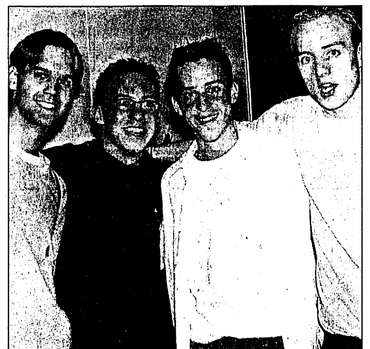
Gutgelaunte Lihga-Besucher geniessen die tolle Stimmung im Festzelt und in der Bar.