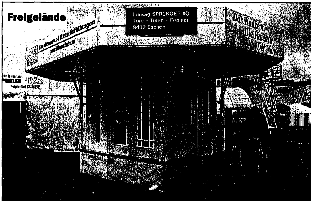
Bei den Haustüren von Ludwig SPRENGER AG können Sie sicher sein, dass sie halten, was sie versprechen.

Seien Sie herzlich willkommen bei unserem Lihga-Stand oder bei unserer Ausstellung in Eschen