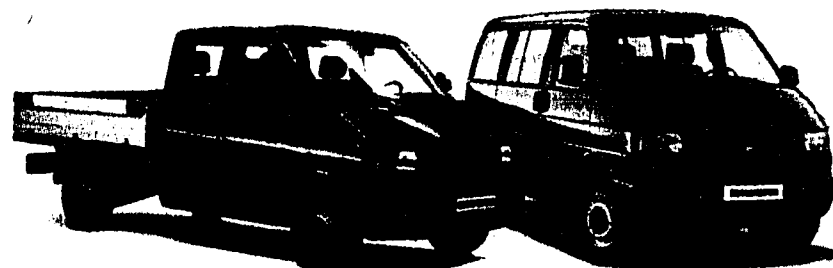
VW Transporter Doppelkabine

Transporter fahren - Dauersparen! Mit dem 102 PS TDI-Motor drückt der VW Transporter «Swiss Profi» den Verbrauch auf historische Tiefstwerte. Und die Rentabilität auf ungeahnte Höchstwerte. 6,8 Liter auf 100 km: so wenig braucht er, um seine Vorzüge voll auszuspielen: also die unschlagbare Zuverlässigkeit, die hohe Flexibilität, das lückenlose Sicherheitskonzept. Schon ab Fr. 27'680.- macht sich der VW Transporter unermüdet für Sie ans Werk. Ihr VW Nutzfahrzeugvertreter stellt gerne Ihren Wissensdurst.