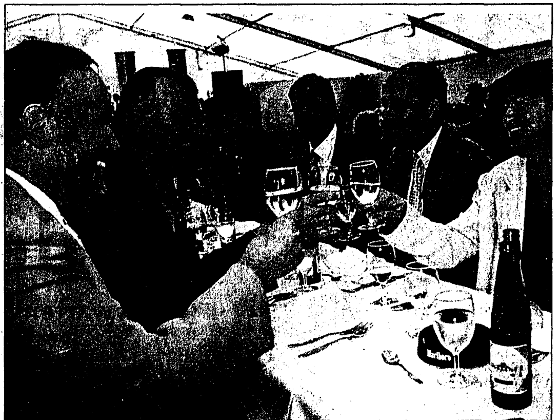
Fröhliche Stimmung bei der offiziellen Lihga-Eröffnungsfeier am Samstag im Festzelt.