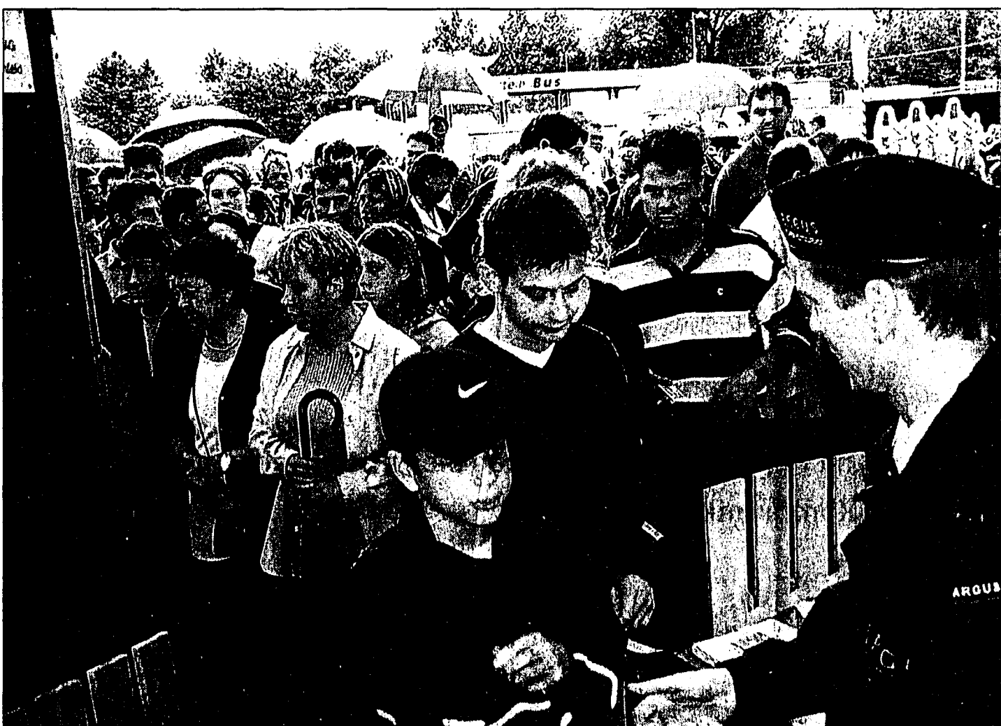
Dank regnerischem und kühlem Wetter herrschte am Sonntag Grossandrang beim Lihga-Eingang.