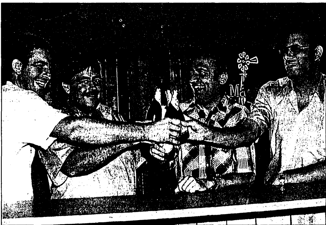
Im Lihga-Festzelt herrschte bis in die frühen Morgenstunden fröhliche Stimmung.