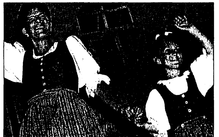
Die Trachtenmodeschau von Jacky's Trachtenmode begeisterte die Zuschauer im Festzelt.